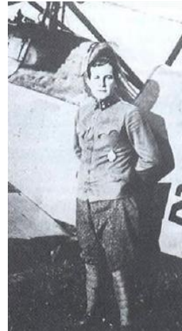
Benno Fiala ve Flik 12D na podzim 1917.

Třetím nejlepším rakousko-uherským esem byl Oberleutnant der Reserve Benno Fiala, Ritter von Fernbrugg. Fiala byl inteligentní, statečný, výborný letec a schopný administrátor. Získal během války 28 potvrzených a 5 nepotvrzených sestřelů. Fiala se narodil 16.6.1890 do vídeňské rodiny se silnými vazbami na armádu. Na Technické univerzitě ve Vídni získal diplom inženýra. Vstoupil dobrovolně do armády v roce 1910 a byl přidělen jako Offizieranwärter k 1. dělostřeleckému pluku. Seznámil se s Emilem Uzelacem, velitelem LFT a byl fascinován létáním. 28.7.1914 byl díky němu převeden k LFT a přidělen k Fliegerkompanie 1. Po vypuknutí války byla Flik 1 přidělena na haličskou frontu. Fiala zde byl nejdříve jako technický důstojník jednotky a brzy jako letecký pozorovatel. 31.7.1914 poprvé vzlétl jako pozorovatel u Flik 1 v letounu Lohner B.III s pilotem Erdsteinem.